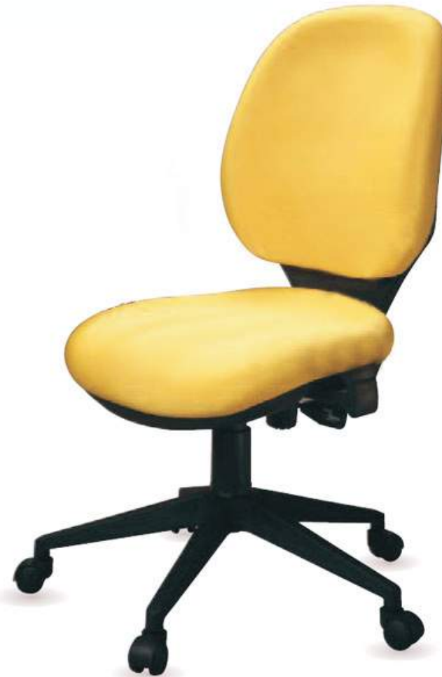
Logan sin brazos